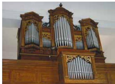
Református templom orgonája