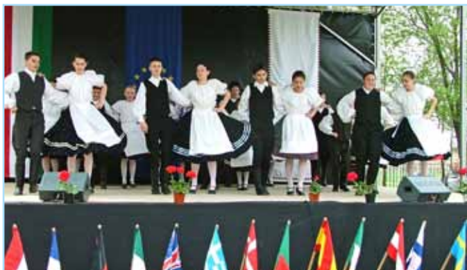
Az iskola néptáncosai