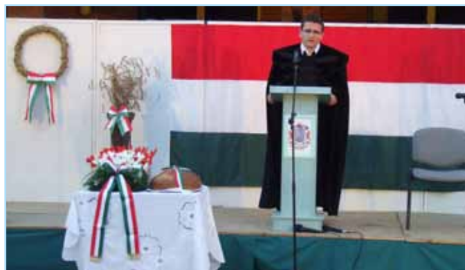
Szent István nap