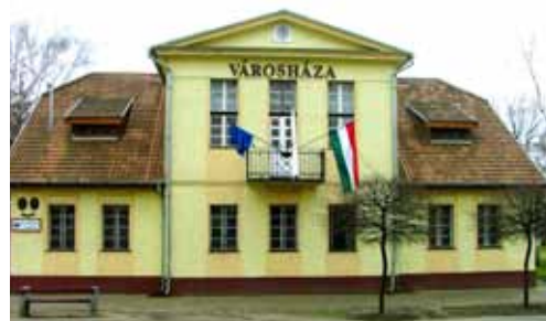
Városháza. Épült 1936-ban