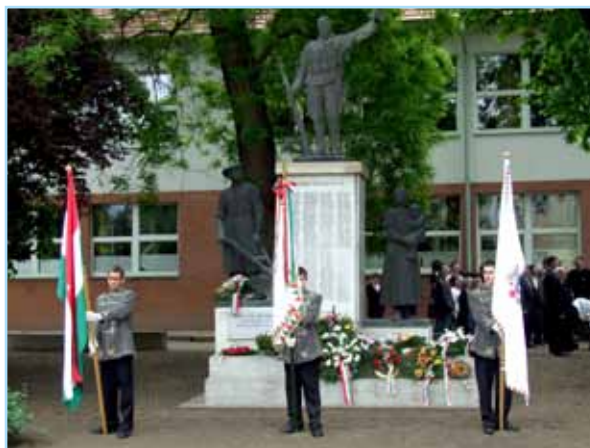
Megemlékezés a világháborús emlékműnél