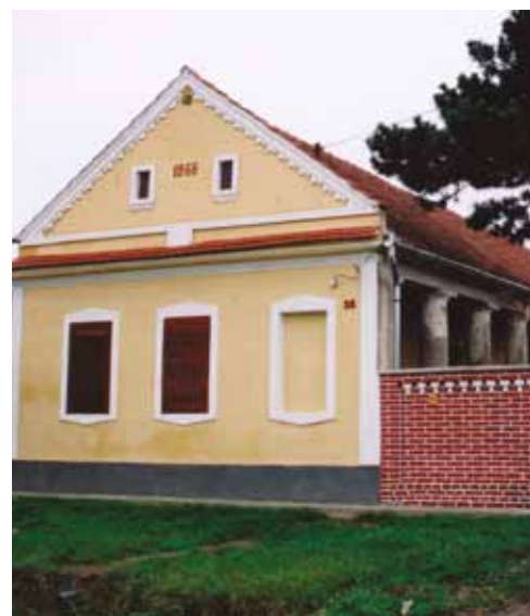
Régi ház (1866)