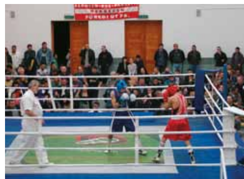
Harangi Imre ökölvívó emlékverseny