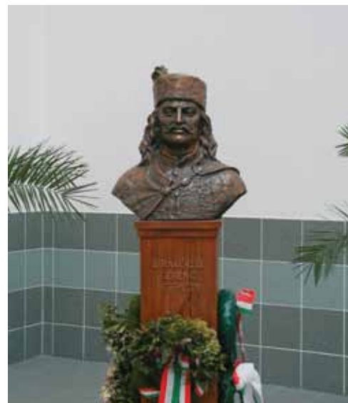
II. Rákóczi Ferenc mellszobra az iskolában

A szabadságharc idején három nemzetőr csapatot állítottak 240 fővel. 1848 után itt is megindult a jobbágyfelszabadítás. Az ötvenes években folyt az ún. úrbéri vagy tagosítási per, melynek lezárultával életbe léphetett a határ új birtoklási rendje. A dualizmus idején több változás volt a község életében. 1871-ben nagyközség lett, 1876-ban pedig Hajdú Vármegyéhez csatolták. Ettől kezdve használatos a Hajdú- előtag a község nevében. A polgárosodásnak és az ipar fejlődésének itt is vannak nyomai, de alapvetően marad a mezőgazdasági jelleg. A XIX. század végén megélénkült a társasági életre utal az Olvasóegylet, nőegylet, Kossuth Kör megalakulása. A XX. század elején két közút, vasútvonal, pénzüintézetek alakulnak.