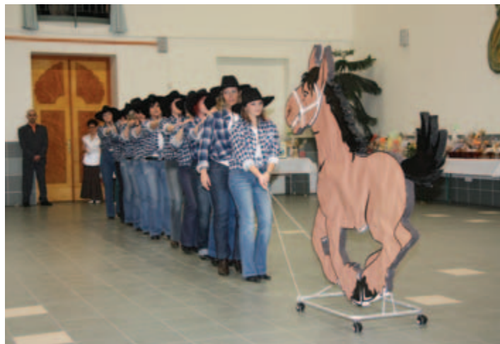
Cowboy-lányok vagy cowboy óvó néni?