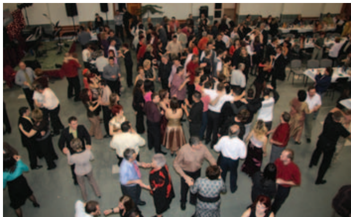
Báloztak az óvodában