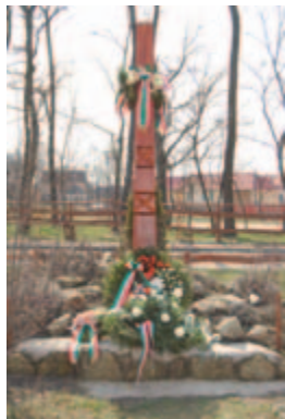
Március 15-e, Sámsonkert