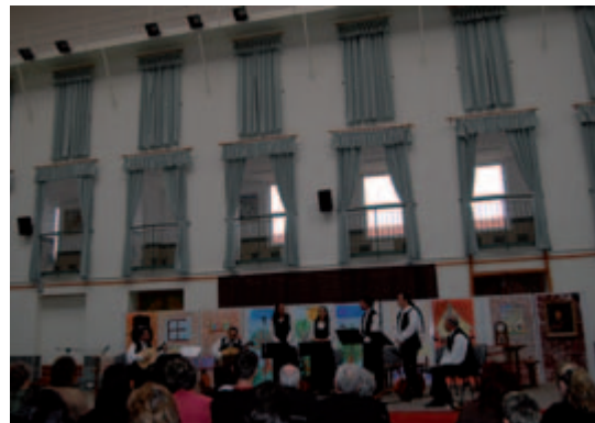
A Nagykárolyi Collegium Együttes