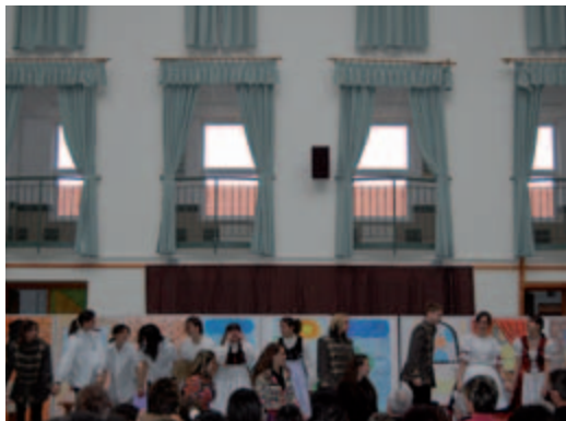
A Rákóczi-bét záró ünnepsége