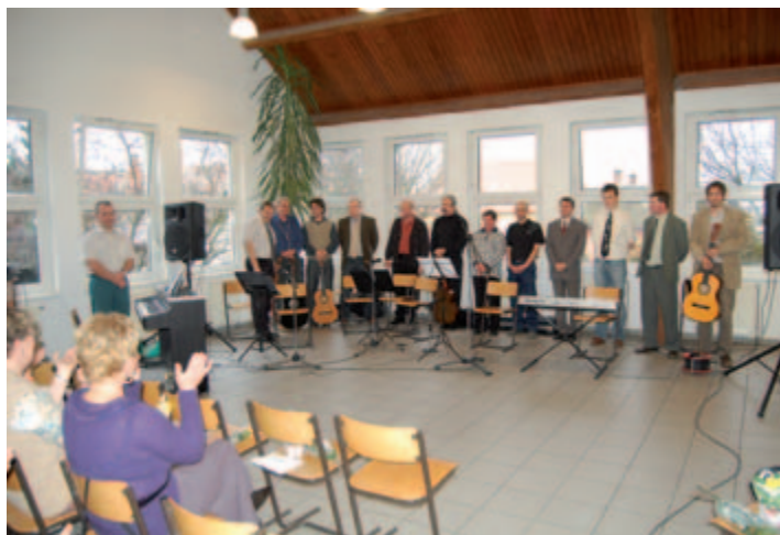
Nőnap ünnepség az iskolában. Kitétek magukért a férfiak...